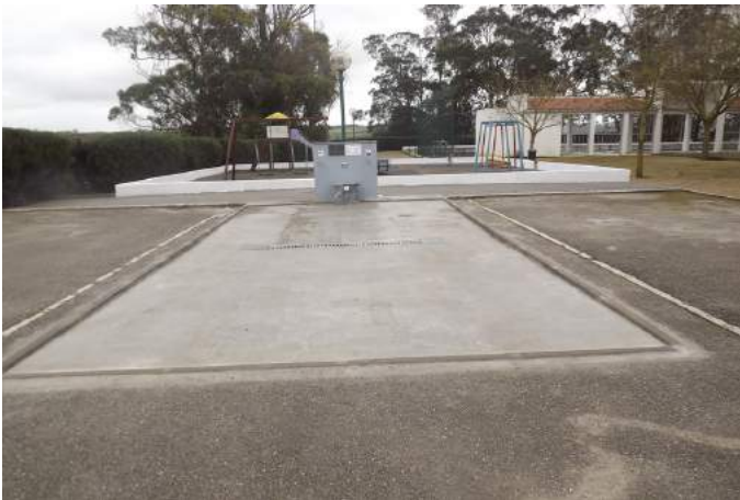
Área de Serviço de Sobral de Monte Agraço