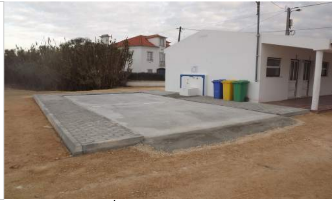
Área de Serviço da Lourinhã