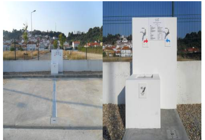
Área de Serviço de Coruche