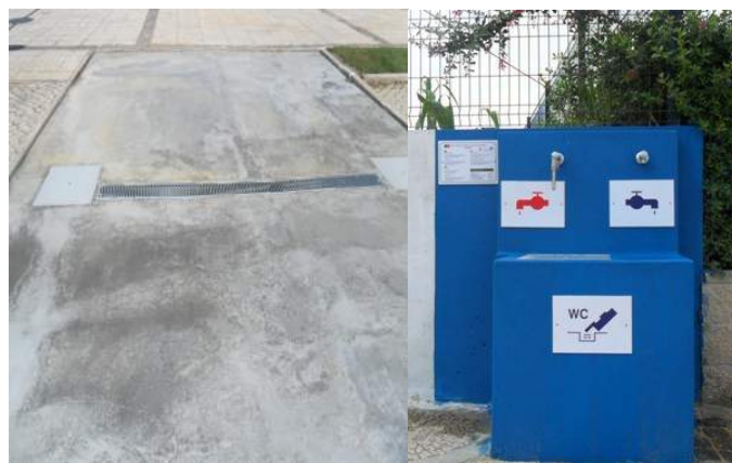
Área de Serviço de A-dos-Cunhados – Torres Vedras