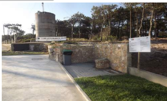
Área de Serviço da Praia da Falca – Nazaré