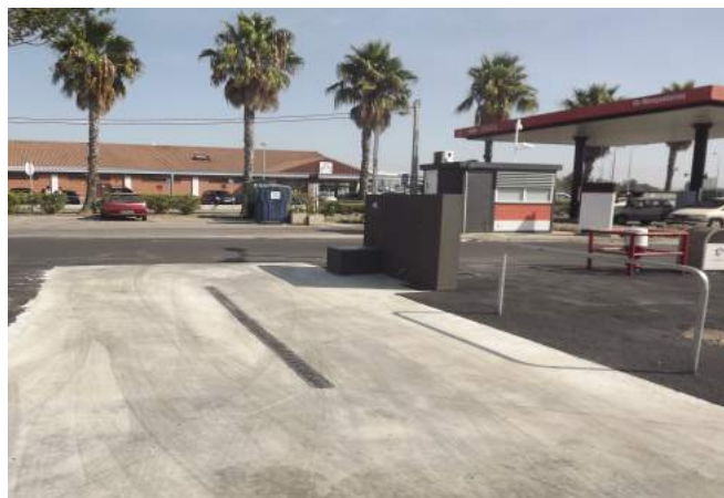
Área de Serviço do INTERMARCHÉ de Alenquer

Para receber o Projeto Técnico das Áreas de Serviço para autocaravanas, bem como para qualquer esclarecimento técnico, contacte-nos para: