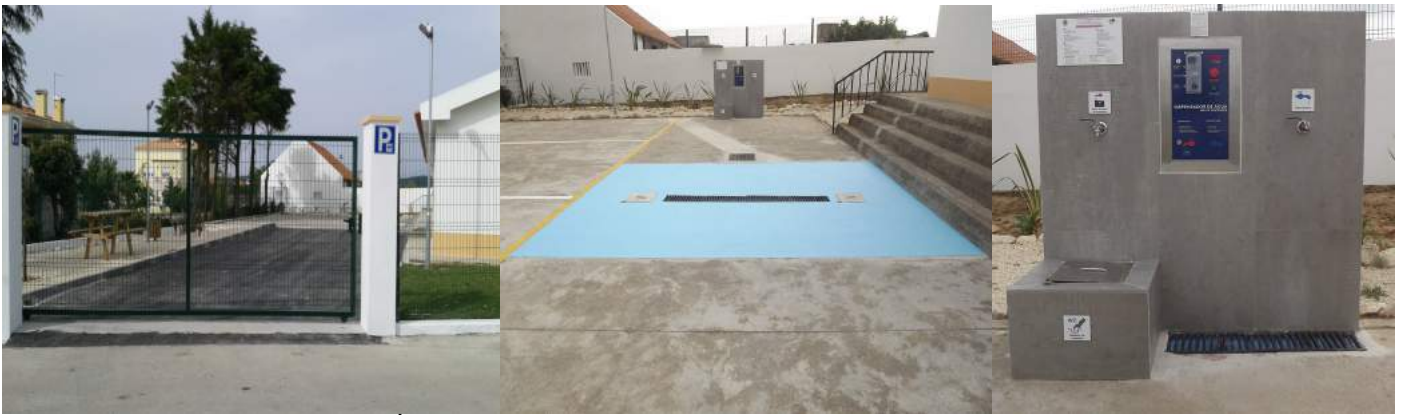
Área de Serviço da Sede do Clube Autocaravanista Saloio