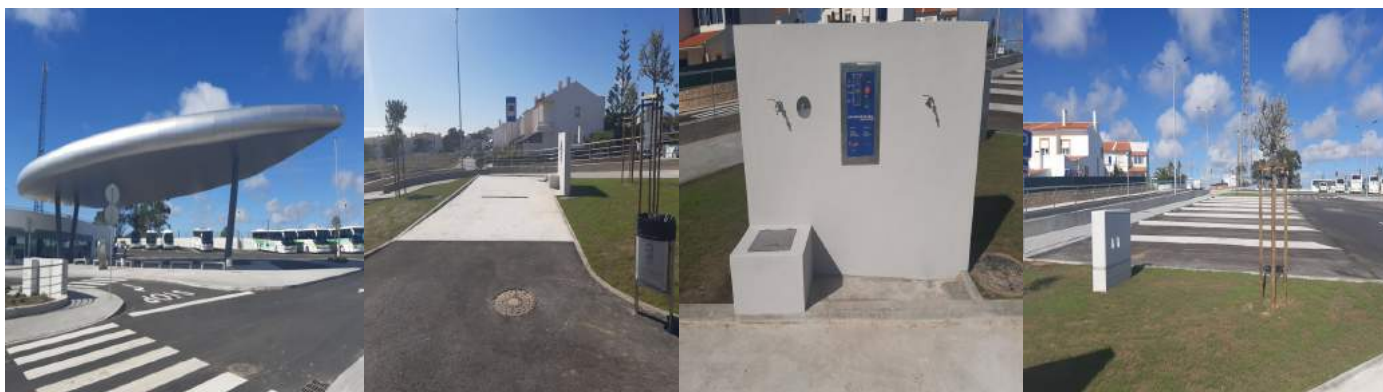
Área de Serviço do Parque Intermodal da Ericeira - Mafra