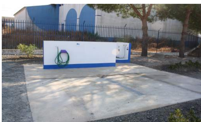
Área de Serviço da Quinta da Cerca - Aljustrel