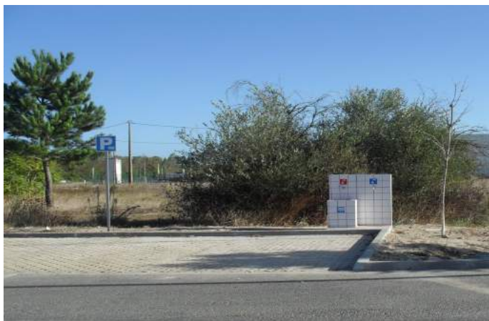
Área de Serviço do INTERMARCHÉ de Benavente