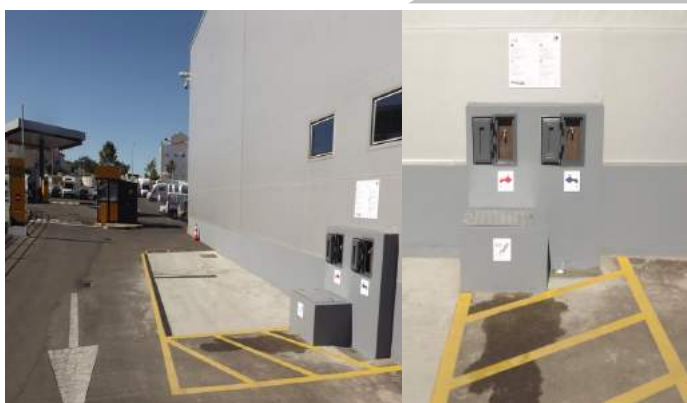
Área de Serviço do INTERMARCHÉ de Elvas