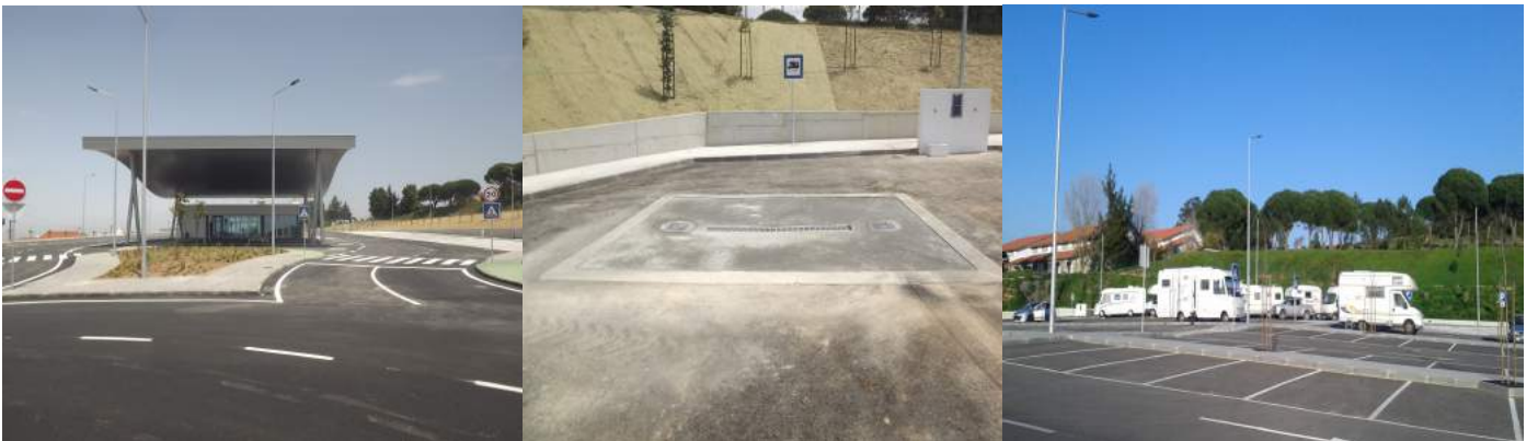
Área de Serviço do Parque Intermodal do Alto da Vela - Mafra