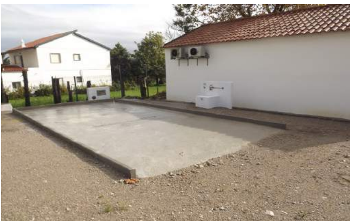
Área de Serviço de Reguengo Grande - Lourinhã