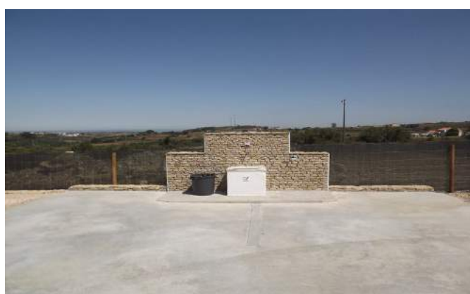
Área de Serviço de Odrinhas Park - Sintra