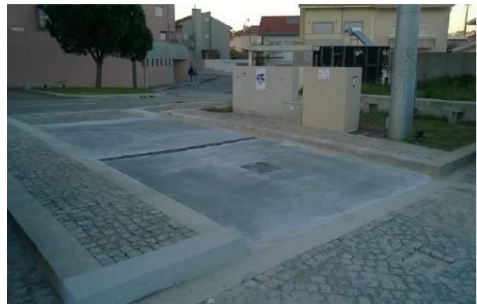
Área de Serviço de Rio Tinto – Gondomar