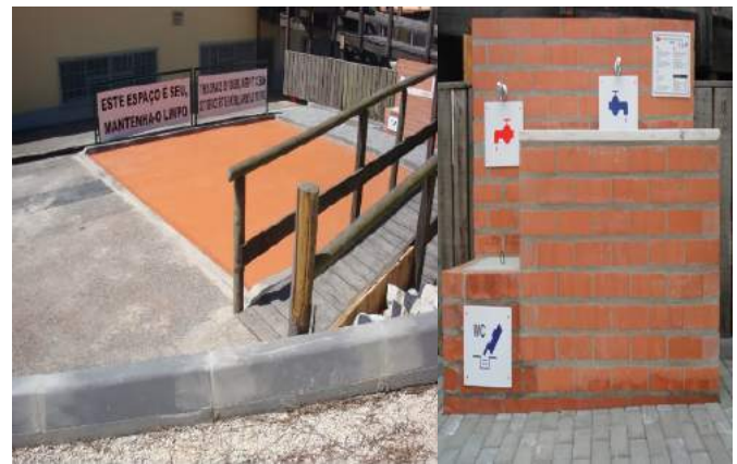
Área de Serviço de Outeiro da Cabeça – Torres Vedras