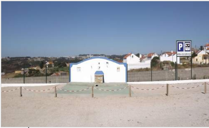
Área de Serviço de Santa Susana – Sintra