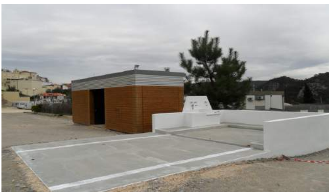
Área de Serviço de Penacova